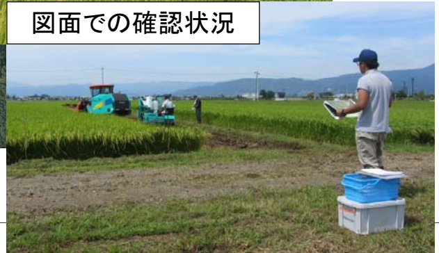
図面での確認状況