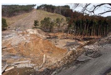
堰堤の右岸が決壊