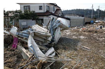
洪水による建物の被害