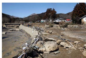
洪水による橋の被害