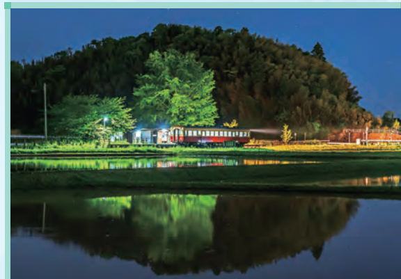
第27回 千葉県土地改良事業団体連合会長賞