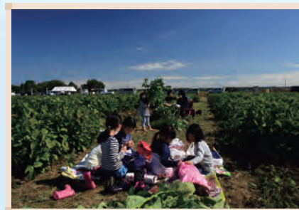
第27回 ちば水土里支援パートナー賞