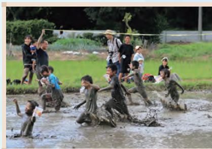
第27回 千葉県多面的機能推進協議会賞