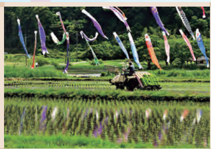
第27回 千葉県農村振興技術連盟賞